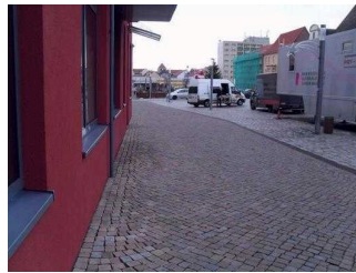
Blick auf den Parkplatz