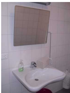
Waschbecken mit Spiegel