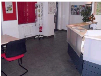
Blick auf den Eingang mit Sitzmöglichkeit