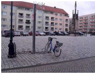
Parkplätze direkt vor der Tür