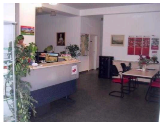
Blick in den Raum

BREITE der Bewegungsfläche vor dem Schalter/Tresen/der Kasse: 200 cm