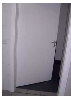
Tür von innen