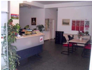
Weg zum Tresen