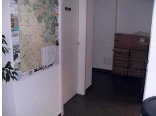
Weg zum WC