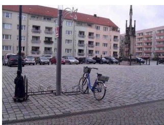
Parkplätze direkt vor der Tür