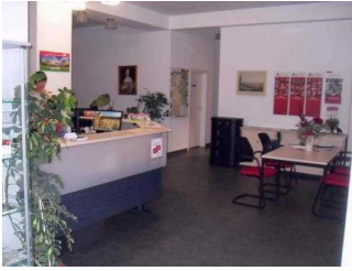
Weg zum Tresen