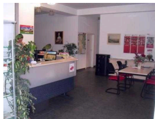
Blick in den Raum

Der Schalter/Tresen/die Kasse ist von der Eingangstür aus direkt sichtbar.