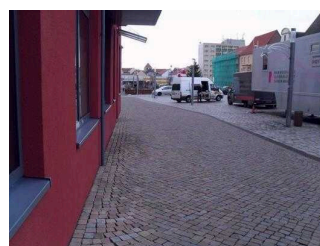
Blick auf den Parkplatz