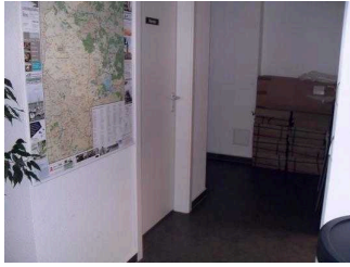
Weg zum WC