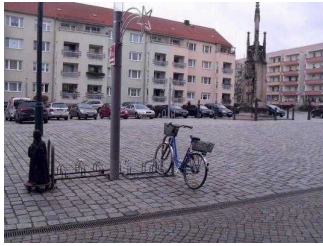
Parkplätze direkt vor der Tür