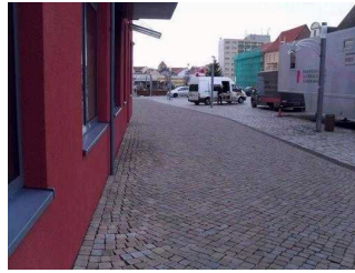
Blick auf den Parkplatz