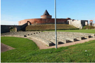
Station/Objekt/ Exponat außen