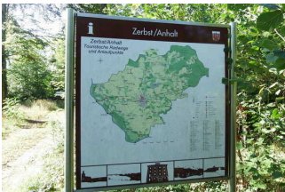
Info-Punkt des Naturparks Fläming