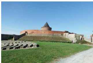
Rundwanderweg Lindau – Natur- und Kulturpfad im Fläming