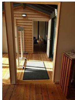
Weg vom Eingang zum Mutimediarraum