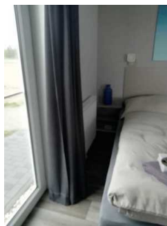
Schlafraum Fewo 8, links neben dem Bett