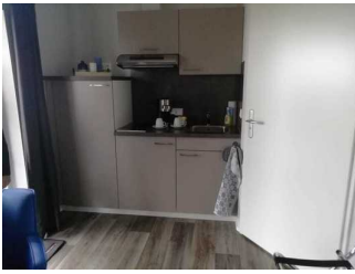
Küche Fewo 8