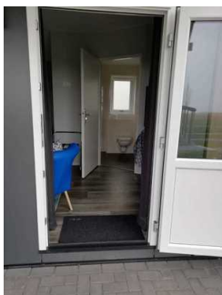
Tür zur Fewo 8 - Schlafraum