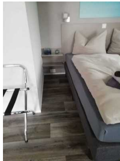
Schlafraum Fewo 7