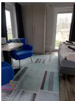
Schlafraum Fewo 8