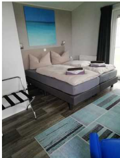
Schlafraum Fewo 7