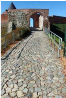
Weg außen vom Parkplatz zum Burgtor