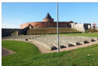
Station/Objekt/ Exponat außen

Anmerkungen für den Gast: Die Burg ist Ausgangs- und Endpunkt des Rundwanderweges