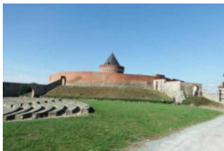
Rundwanderweg Lindau – Natur- und Kulturpfad im Fläming