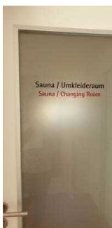
Tür zum Sauna-/ Ruhebereich