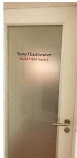
Tür zum Sauna-/ Ruhebereich