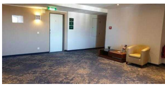
Bewegungsfläche vor dem Aufzug in den oberen Etagen