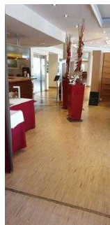
Weg von der Rezeption zum Restaurant / Tagungsraum Gerhard / Treppe zum UG