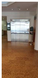
Aufzug im EG, rechts daneben befindet sich die Rezeption