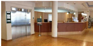
Luther Hotel Wittenberg