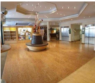
Weg von der Rezeption zum Restaurant / Tagungsraum Gerhard / Treppe zum UG