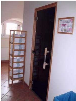
Tür zur Saunakabine