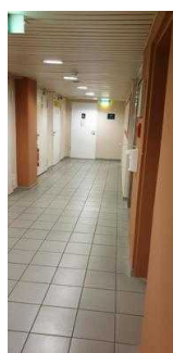
Weg im UG vom Aufzug zum öffentlichen WC