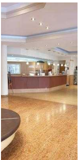
Weg vom Eingang zur Rezeption