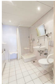
Badezimmer im Zimmer 101