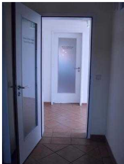
Blick aus dem Saunabereich Richtung Flur