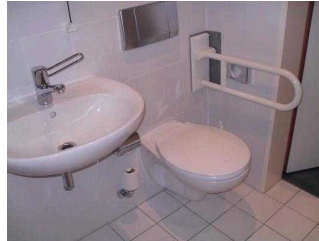
Badezimmer im Zimmer 101