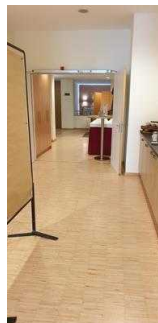
Weg von der Rezeption zum Restaurant / Tagungsraum Gerhard / Treppe zum UG