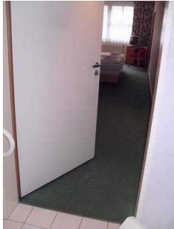
Zimmertür, Badezimmer im Zimmer 101