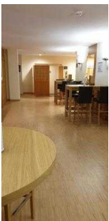
Weg von der Rezeption zum Restaurant / Tagungsraum Gerhard / Treppe zum UG