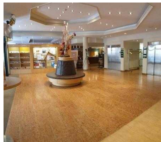
Weg vom Eingang zur Rezeption