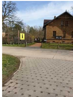
Weg vom Parkplatz zur Eingangstür Außengelände