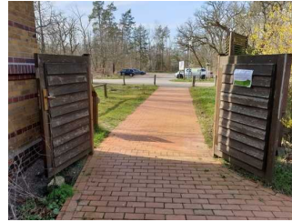
Eingangstür zum Außengelände am Auenhaus