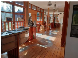
Weg vom Eingang zum WC