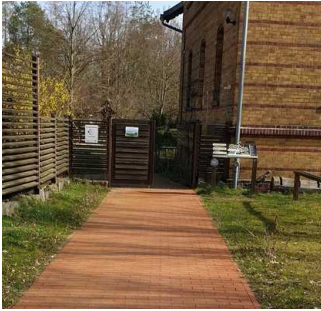
Eingangstür zum Außengelände am Auenhaus