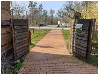
Weg vom Parkplatz zur Eingangstür Außengelände