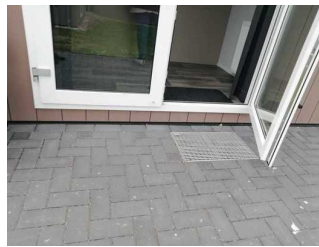
Stufe ins Rezeptionshaus