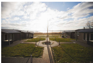
Lodgepark Goitzsche - Ferienhaus Chatel, Wohnung 7 und 8