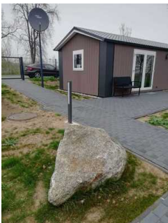
Rampe am Eingang zum Lodgepark (am Rezeptionshaus)