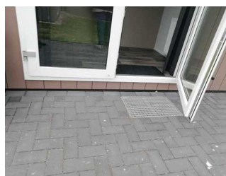
Stufe ins Rezeptionshaus