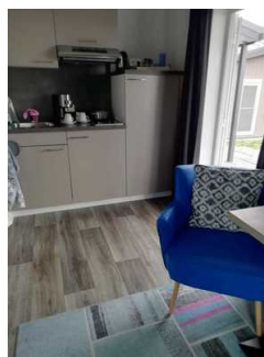
Küche Fewo 7

Breite des schmalsten Durchgangs in der Küche: 110 cm