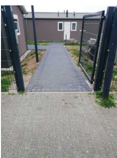
Rampe vom Eingangstor gesehen