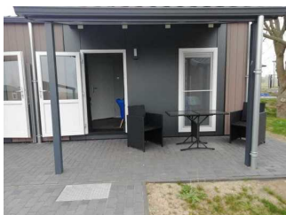
Eingangsbereich Lodgepark (Kopie)