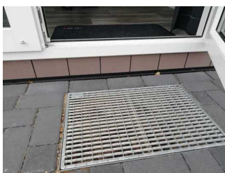
Stufe ins Rezeptionshaus