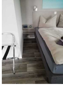
Schlafraum Fewo 7