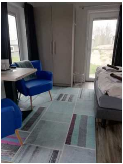
Schlafraum Fewo 8