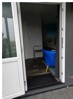
Eingangsbereich Lodgepark (Kopie)