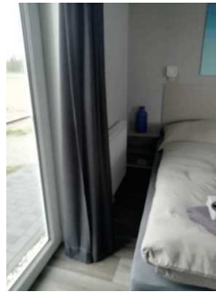
Schlafraum Fewo 8, links neben dem Bett