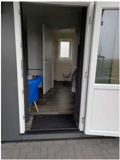
Tür zur Fewo 8 - Schlafraum