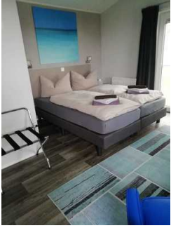
Schlafraum Fewo 7