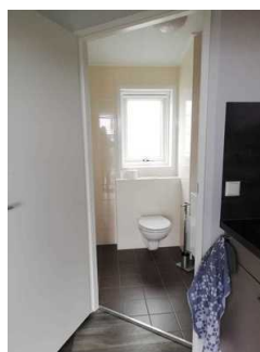
Tür zum Sanitärraum