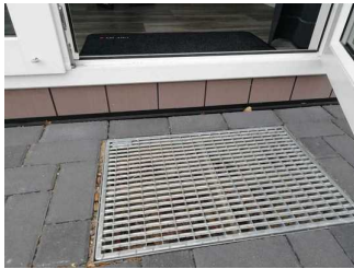
Stufe ins Rezeptionshaus