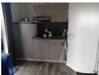
Küche Fewo 8