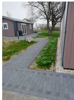
Bewegungsfläche am Ende der Rampe