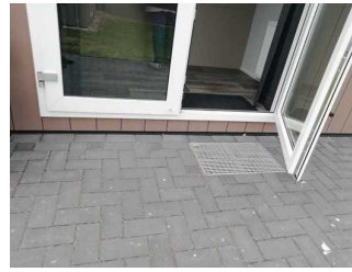
Stufe ins Rezeptionshaus