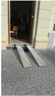
Mobile Rampe am Eingang