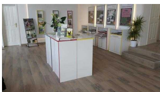
Kundenraum mit Infotresen und Exponaten / Schauvitrienen