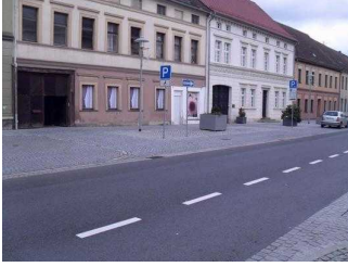
Weg vom Parkplatz zum Eingang