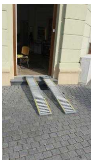
Stufe am Eingang