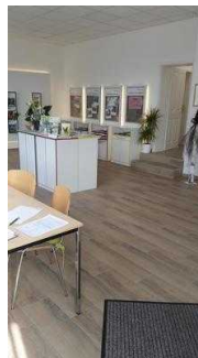
Weg im Raum