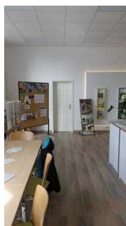
Kundenraum mit Infotresen und Exponaten / Schauvitrienen