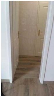
Zugang zum öffentlichen WC