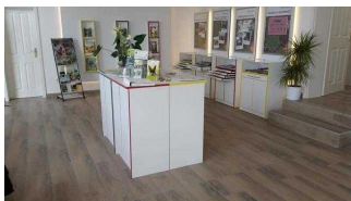
Naturpark Fläming InfoCenter in Coswig