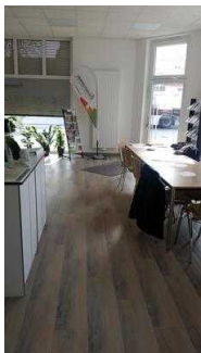
Weg im Raum