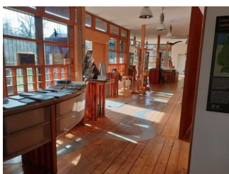
Weg vom Eingang zum WC