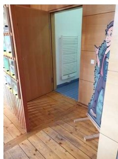
Weg vom Eingang zum WC