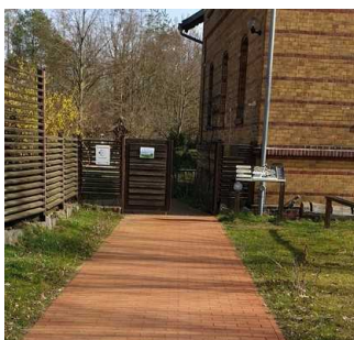
Eingangstür zum Außengelände am Auenhaus