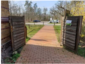
Weg vom Parkplatz zur Eingangstür Außengelände