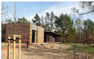
Auenhaus - Informationszentrum der Biosphärenreservatsverwaltung Mittelelbe