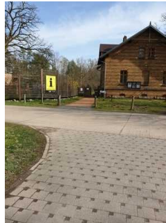
Weg vom Parkplatz zur Eingangstür Außengelände