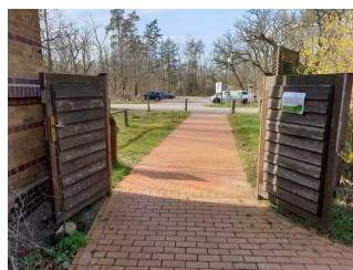
Eingangstür zum Außengelände am Auenhaus