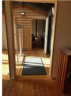
Weg vom Eingang zum Mutimediaraum