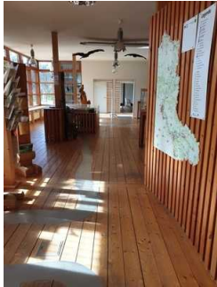
Weg vom Eingang zum Mutimediaraum