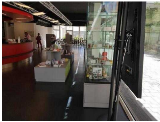
Weg vom Eingang zum Schalter