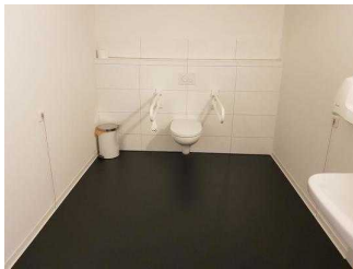
Öffentliches WC für Menschen mit Behinderung