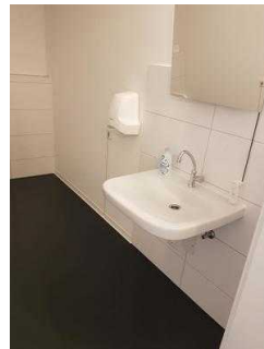
Öffentliches WC für Menschen mit Behinderung