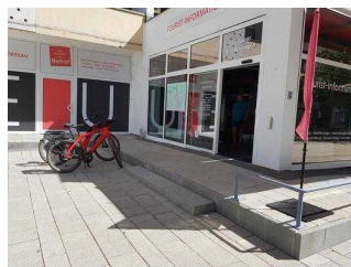
Stufen am Eingang