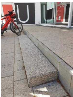
Stufen am Eingang