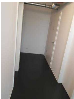
Tür zum WC (hinten rechts)