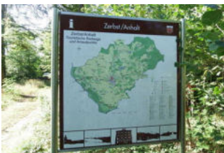
Info-Punkt des Naturparks Fläming

Es gibt einen visuellen Kontrast zwischen der Station / dem Objekt/Exponat und der Umgebung.