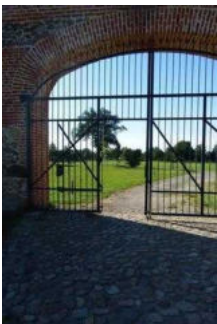
Tor zum Beginn des Rundweges