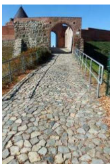
Weg außen vom Parkplatz zum Burgtor