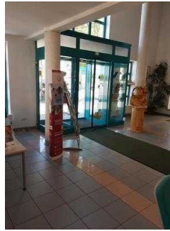
Weg vom Eingang zum Counter