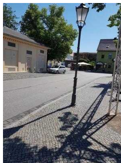
Blick in Richtung Parkplatz