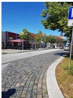
Blick in Richtung Touristinfo