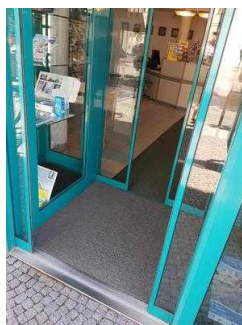
Türen im Eingangsbereich