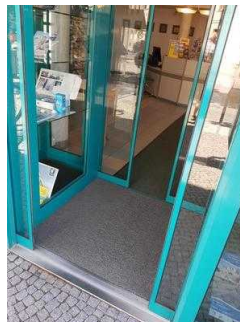
Türen im Eingangsbereich