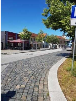
Blick in Richtung Touristinfo