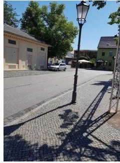
Blick in Richtung Parkplatz