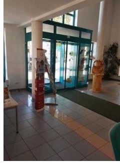
Weg vom Eingang zum Counter