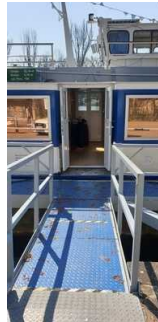
Zugang zum Schiff