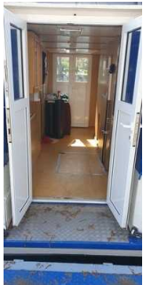
Zugang zum Schiff