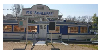
Ein- und Aussteigemöglichkeit direkt am Schiffsanleger