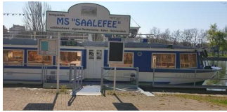
Zugang zum Schiff