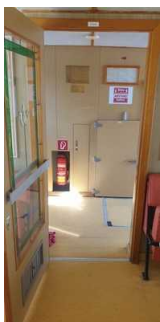
Unterdeck: Eingangstür in den Fahrgastraum