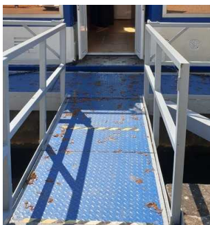
Schwimmanleger zwischen Gangway und Eingang