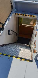
Treppe zum Oberdeck