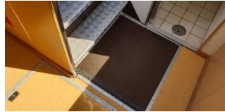
Bewegungsfläche vor der Treppe zum Oberdeck