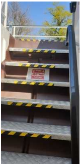
Treppe zum Oberdeck