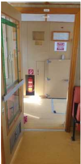
Unterdeck: Eingangstür in den Fahrgastraum