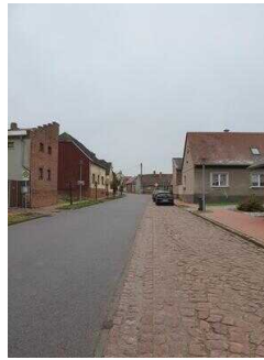
Hauptroute 33 km, 2. Abschnitt: Mosigkau – Chörau – Reppichau