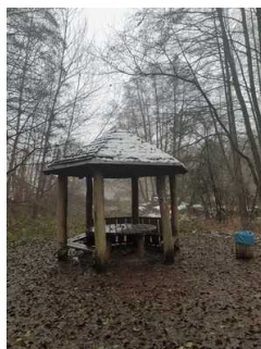
Rastplatz ca. 3 km vor Infopunkt Mosigkau