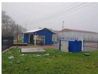
Wasser- und Gesundheitspark Aken