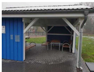
Wasser- und Gesundheitspark Aken