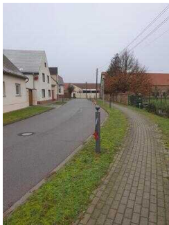
Hauptroute 33 km, 2. Abschnitt: Mosigkau – Chörau – Reppichau