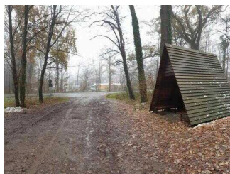
Schutzhütte am Ortseingang Aken