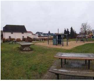
Rastplatz in Osternienburg