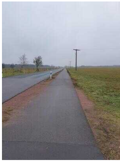
Hauptroute 33 km, 2. Abschnitt: Mosigkau – Chörau – Reppichau