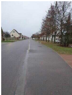
Hauptroute 33 km, 2. Abschnitt: Mosigkau – Chörau – Reppichau