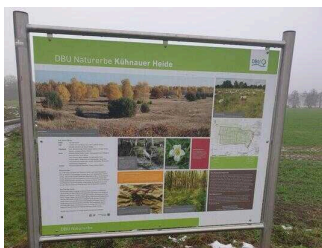
Hinweisschilder am Radweg