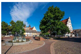
Aken, Markt mit Brunnen, 2020