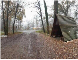
Schutzhütte am Ortseingang Aken