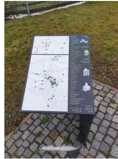
Hinweisschilder am Radweg