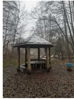
Rastplatz ca. 3 km vor Infopunkt Mosigkau