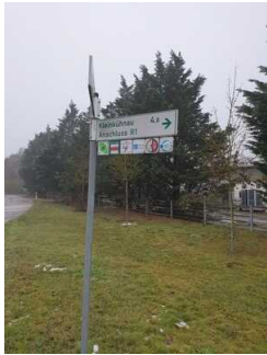
Hinweisschilder am Radweg