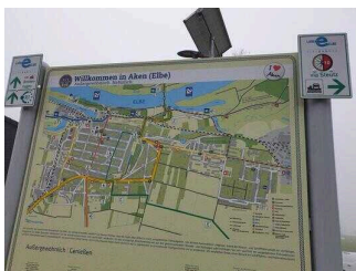
Hinweisschilder am Radweg