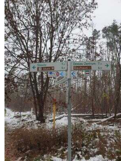
Hinweisschilder am Radweg