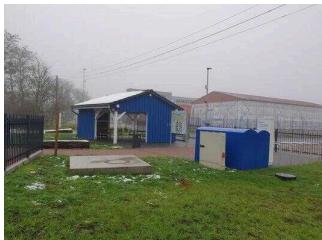
Wasser- und Gesundheitspark Aken