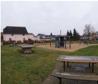
Rastplatz in Osternienburg