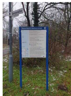
Hinweisschilder am Radweg