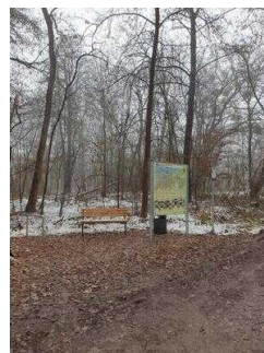
Hinweisschilder am Radweg