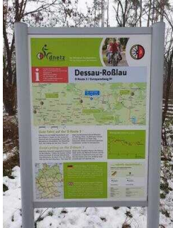
Hinweisschilder am Radweg