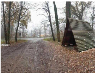
Schutzhütte am Ortseingang Aken