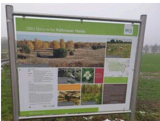
Hinweisschilder am Radweg