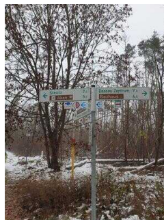
Hinweisschilder am Radweg