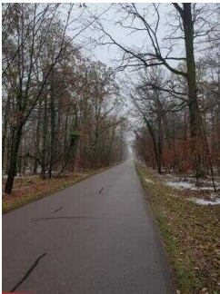
Hauptroute 33 km, 3. Abschnitt: Reppichau – Elsnigk – Osternienburg – Köthen (Anhalt)