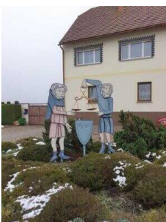
Hauptroute 33 km, 3. Abschnitt: Reppichau – Elsnigk – Osternienburg – Köthen (Anhalt)