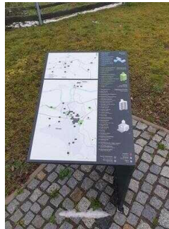
Hinweisschilder am Radweg