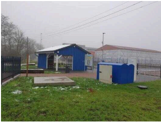
Wasser- und Gesundheitspark Aken