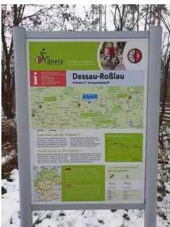
Hinweisschilder am Radweg