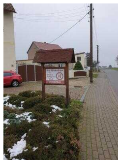
Hauptroute 33 km, 3. Abschnitt: Reppichau – Elsnigk – Osternienburg – Köthen (Anhalt)