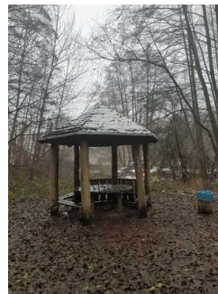
Rastplatz ca. 3 km vor Infopunkt Mosigkau