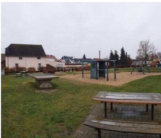
Rastplatz in Osternienburg