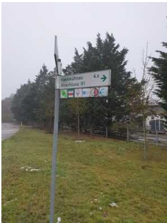
Hinweisschilder am Radweg