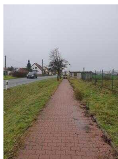
Hauptroute 33 km, 3. Abschnitt: Reppichau – Elsnigk – Osternienburg – Köthen (Anhalt)