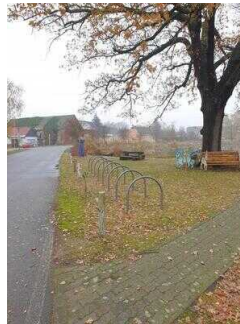
Hauptroute 33 km, 3. Abschnitt: Reppichau – Elsnigk – Osternienburg – Köthen (Anhalt)