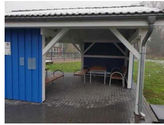
Wasser- und Gesundheitspark Aken