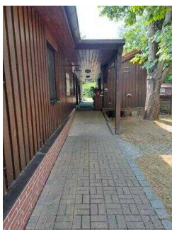
Rampe am Nebeneingang