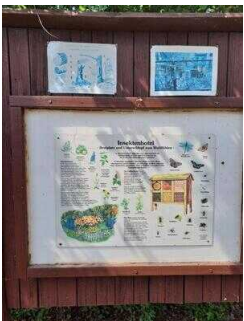
Außengelände mit Infotafeln