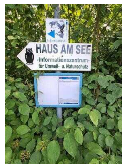
Versteckte Ausschilderung am Parkplatz (kurz vor dem Rampenweg)