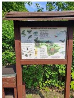
Außengelände mit Infotafeln