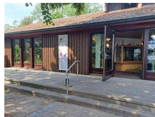
Haus am See Schlaitz – Haupteingang