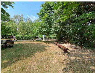
Außengelände mit Infotafeln