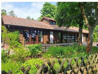
Haus am See Schlaitz – Informationszentrum für Umwelt und Naturschutz