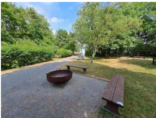
Außengelände mit Infotafeln