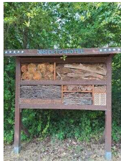
Außengelände mit Infotafeln