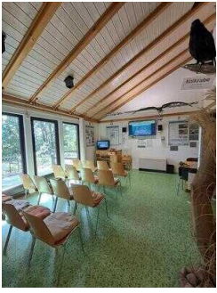
Ausstellungsraum mit Livecam in den Adlerhorst