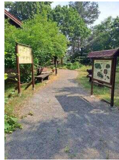
Außengelände mit Infotafeln und Sitzmöglichkeiten