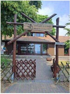
Eingang zum Außengelände