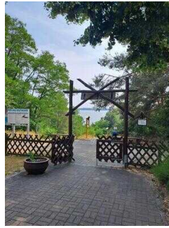
Eingang zum Außengelände