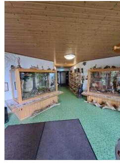
Ausstellungsvitrinen mit Blick auf den Nebeneingang