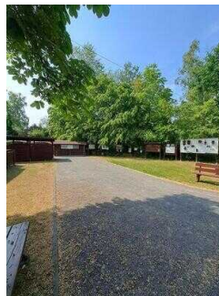
Außengelände mit Infotafeln