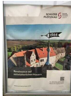
Mittelalterliche Burganlage Plötzkau