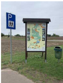
Wanderweg "Plötzkauer Auenwald"