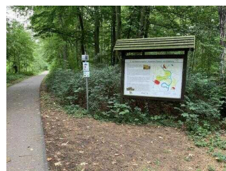
Wanderweg "Plötzkauer Auenwald"