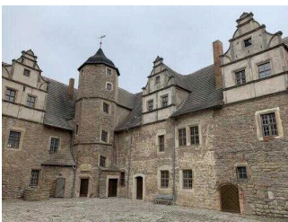
Mittelalterliche Burganlage Plötzkau