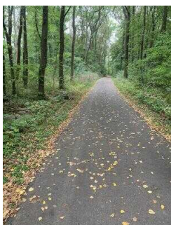
Wanderweg "Plötzkauer Auenwald"