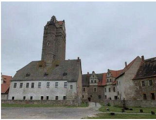
Mittelalterliche Burganlage Plötzkau