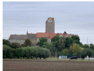
Wanderweg "Plötzkauer Auenwald"