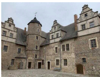
Mittelalterliche Burganlage Plötzkau