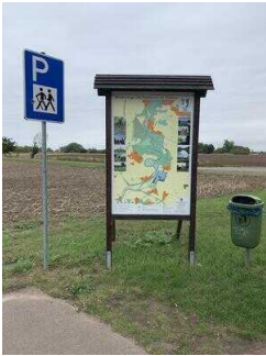
Wanderparkplatz am Schloss Plötzkau