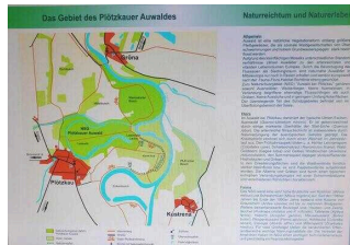
Wanderweg "Plötzkauer Auwald"