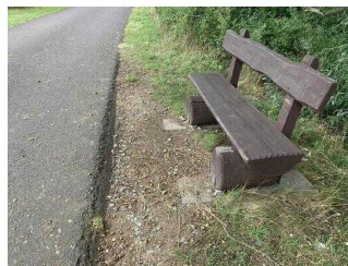
Wanderweg "Plötzkauer Auwald"