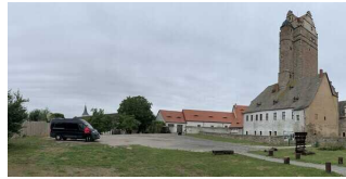
Wanderparkplatz am Schloss Plötzkau