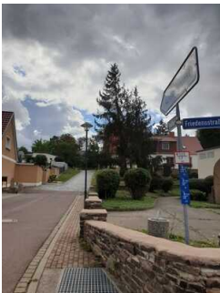
Parkplätze an der Strasse am Saalberg