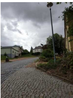
Parkplätze an der Strasse am Saalberg