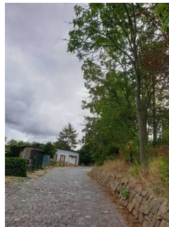
Parkplätze an der Strasse am Saalberg