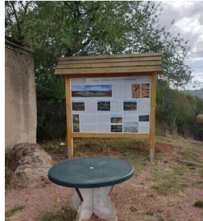
Informationstafeln am Infopunkt