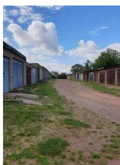
50 m Weg durch den Garagenkomplex Richtung Informations- und Aussichtspunkt auf dem Saalberg