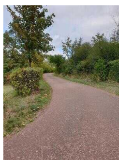
Weg zum Informations- und Aussichtspunkt auf dem Saalberg in Rothenburg