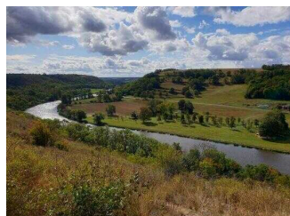
Blick auf die Saale