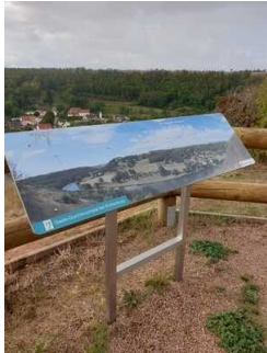
Informationstafeln am Infopunkt