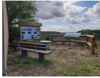
Informations- und Aussichtspunkt auf dem Saalberg in Rothenburg