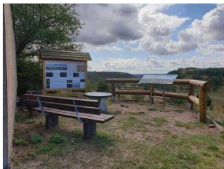
Informations- und Aussichtspunkt auf dem Saalberg in Rothenburg