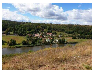
Informations- und Aussichtspunkt auf dem Saalberg in Rothenburg