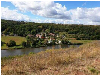
Blick auf die Saale