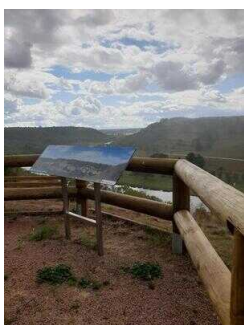
Informations- und Aussichtspunkt auf dem Saalberg in Rothenburg