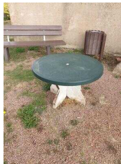
Informations- und Aussichtspunkt auf dem Saalberg in Rothenburg