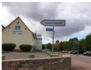
Ausschilderung in Rothenburg