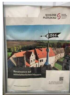
Mittelalterliche Burganlage Plötzkau