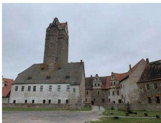
Mittelalterliche Burganlage Plötzkau